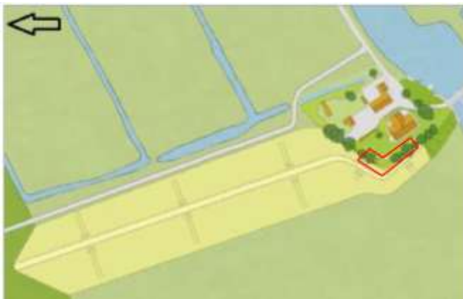
Figuur 2 - Traject Reeve. In het rood is omcirkeld het projectgebied waar beplanting wordt verwijderd. De pijl geeft het noorden aan.

Aan de zuidkant van het traject Reeve bevindt zich de boerderij met erfbeplanting. Een klein deel van de beplanting op het erf dient verwijderd te worden om de dijkverhoging op de meest efficiënte manier te realiseren (zie figuur 2). Het verwijderen van de vegetatie (struikgewas, bomen, overige beplanting) zal in de winterperiode plaatsvinden. De exacte planning voor het uitvoeren van de werkzaamheden moet nog worden vastgesteld.