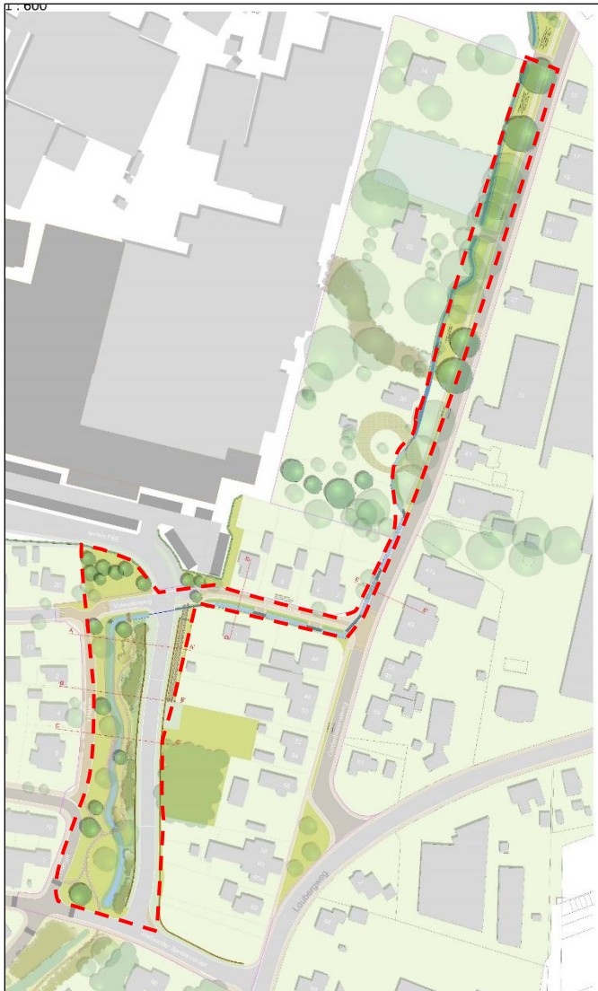
Figuur 1: begrenzing projectgebied

Het doel van het inpassingsplan voor FBE is om een goede balans te vinden tussen bedrijvigheid en het woon- en leefklimaat. De wens is om de papierindustrie rond Eerbeek te behouden voor de toekomst met daarbij een aanvaardbaar woon- en leefklimaat voor direct omwonenden.